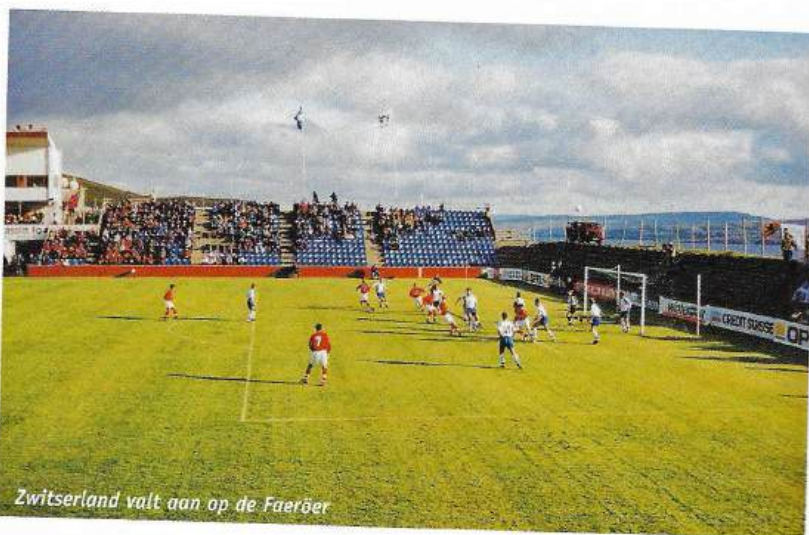
Zwitserland valt aan op de Faeröer